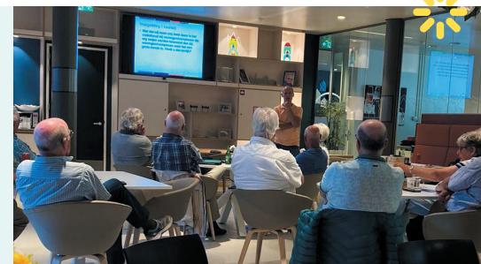
Huurdersraad en bewonerscommissies bij Waterweg Wonen voor de themabijeenkomst onderhoud en duurzaamheid

Ook jij kunt iets betekenen voor andere bewoners! Kijk op het prikbord of er in jouw flat een bewonerscommissie is. En ga gerust eens met de leden praten. Is er geen bewonerscommissie? Laat dat aan de Huurdersraad weten. Misschien kunnen we helpen om een nieuwe bewonerscommissie op te starten. Samen staan we voor de belangen van de bewoners.